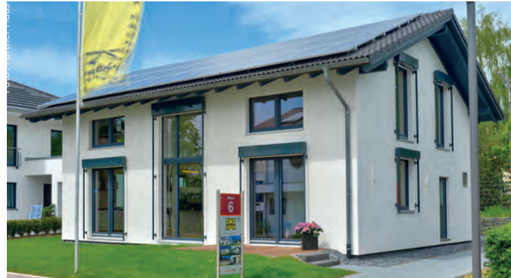
Das einzige Passivhaus in der Wuppertaler Musterhausausstellung hat 65 % mehr Überschüsse als prognostiziert.

Das Wuppertaler Projekt zeigt unfreiwillig, dass diejenigen recht haben, die seit Jahren eine bestmögliche Gebäudehülle fordern, damit die Bewohner dann mit überschaubarer Technik ihre Restwärme erzeugen und möglicherweise sogar Energieüberschüsse produzieren können. Die Idee, Hauskäufern mit der FertighausWelt die Innovationskraft der Hausanbieter